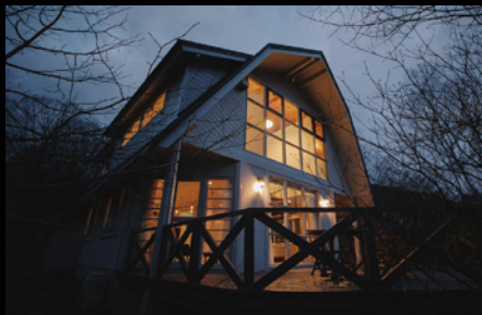
【英国風デザイナーズコテージ】 プレミアムセレクト