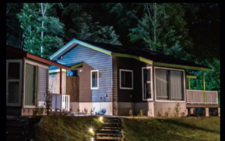
【露天風呂付コテージ】 プレミアムヴィラ

ワンランク上のプレミアムコテージで 森と星に囲まれた贅沢な空間をお楽しみください。