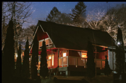
【露天風呂付コテージ】 プレミアムログ

ワンランク上のプレミアムコテージで 森と星に囲まれた贅沢な空間をお楽しみください。